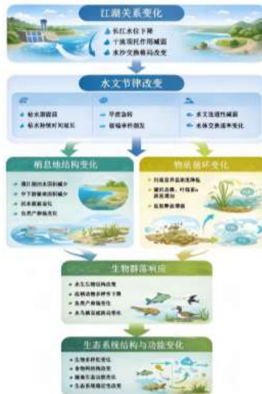
图2 长江流域江湖关系变化-水文节律改变-水生态系统响应的级联效应概念图